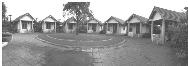
Figure 2 Accommodation in meditation zone of Wanadham Park