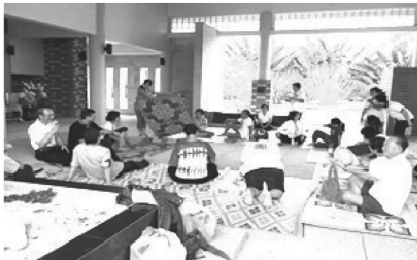
Figure 1 Activies in Wanadham Park

เรียกกิจกรรมลักษณะนี้ว่า กิจกรรมสมาธิในสวน ตั้งอยู่ที่ ถนนเฉลิมพระเกียรติ ร. 9 ซอย 7 (ประตูลาย) แขวงหนองบอน เขตประเวศ กรุงเทพมหานคร ขนาดพื้นที่ 38 ไร่ 3 งาน 46 ตารางวา จัดเป็นสวนสาธารณะระดับชุมชน การเข้าถึง โดยรถส่วนตัว และรถรับจ้างเท่านั้น สวนวรรณธรรมมีการจัดพื้นที่เพื่อรองรับกิจกรรมทางสมาธิ (Figure 1, 2) เช่น มีศาลาปฏิบัติธรรม ลานเดินจงกรม ลานธรรมใต้ต้นไม้ใหญ่ ห้องพักค้างคืน เป็นต้น ในการออกแบบพื้นที่สำหรับกิจกรรมที่ต้องอาศัยความสงบเงียบ ในสวนสาธารณะที่มีกิจกรรมหลากหลายและบางกิจกรรมมีการใช้เสียง ต้องคำนึงถึงปัจจัยรอบด้านเพื่อให้สวนได้รับความพึงพอใจจากผู้ใช้