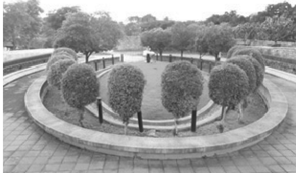
Figure 5 Plants in Wanadham Park

- ความพึงพอใจด้านการออกแบบพื้นที่ สำหรับกิจกรรมทางสมาธิ แบ่งเป็น