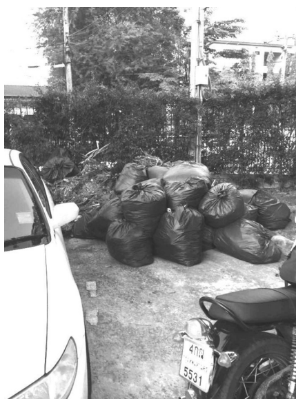
Figure 4 Garbages that were put together at the parking area

ความพึงพอใจที่มีต่อการให้บริการของสวนวนธรรมาด้านการดูแลรักษาที่ดี 2 ประเด็น คือ ความสะอาดของห้องน้ำ และความสะอาดภายในสวนวนธรรมาโดยรวม จากการสำรวจพบว่า ห้องน้ำยังขาดการดูแลอย่างทั่วถึงเนื่องมาจากระบบน้ำชำรุดทำให้ไม่สามารถทำความสะอาดได้ทั่วถึง และมีขยะที่ไม่ได้จัดเก็บเนื่องจากจำนวนถังขยะไม่เพียงพอ