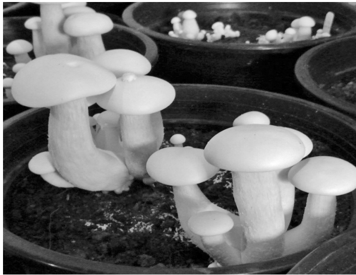
Figure 3 The milky mushroom at 15 days after casing by used sawdust spawn 5 bags/ pot

เมื่อพิจารณาขนาดของดอกเห็ด พบว่า วัสดุเพาะเห็ดที่มีส่วนผสมของรำข้าว 20% และใส่ก้อนเชื้อเห็ดจำนวน 4 3 และ 2 ถุง/กระถาง ดอกเห็ดมีเส้นผ่านศูนย์กลางหมวกดอก 12.7 12.3 และ 12.0 เซนติเมตร ตามลำดับ (Table 6) ส่วนความยาวของก้านดอก พบว่าการใส่ก้อนเชื้อเห็ดจำนวน 5 ถุง/กระถาง มีความยาวก้านดอกมากที่สุด รองลงมาคือการใส่ก้อนเชื้อเห็ด 4 ถุง/กระถาง โดยมีความยาวก้านดอก 14.2 และ 13.9 เซนติเมตร ตามลำดับ นอกจากนี้ ยังพบว่า การใส่ก้อน