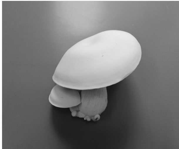
Figure 1 The milky mushroom by used rice bran as a supplement rate of 20%